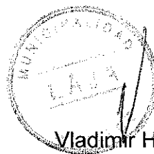
Vladimir Hilich Fica Toledo Alcalde